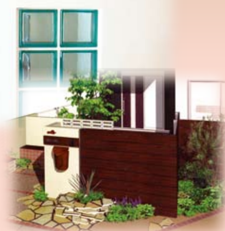
玄関完成イメージ