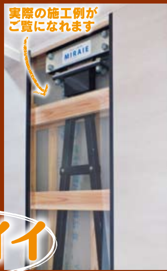
実際の施工例がご覧になれます