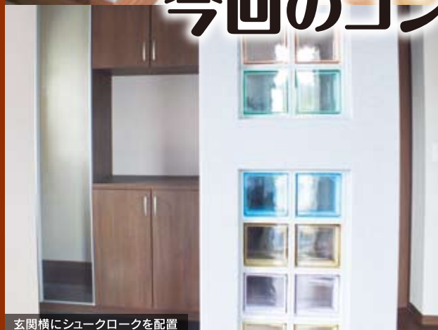
玄関横にシュークロックを配置