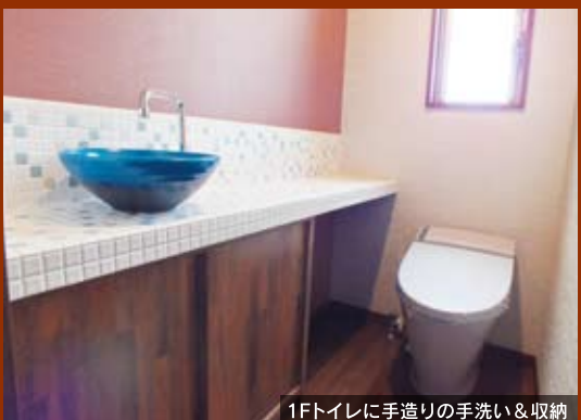
1Fトイレに手造りの手洗い&収納