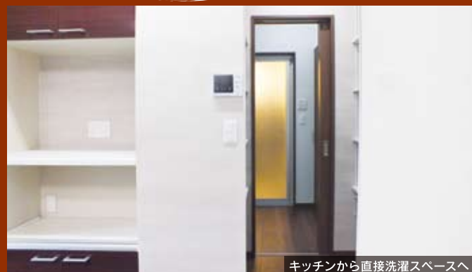
キッチンから直接洗濯スペースへ